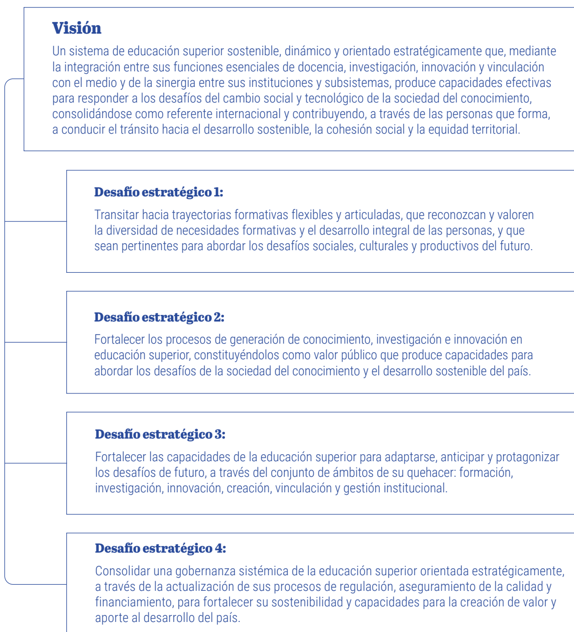
Figura 1. Diagrama de la Estrategia

Cada uno de estos elementos se organiza en un esquema jerárquico para dotar de estructura y legibilidad a la Estrategia (Figura 1). En primer lugar, el Consejo Asesor desarrolló un diagnóstico de la educación superior en Chile a través de comisiones de trabajo organizadas en cuatro ejes: (i) de trayectorias formativas y procesos académicos; (ii) de asociatividad para el desarrollo del conocimiento, la innovación y la internacionalización; (iii) de articulación con entornos y dinamización del desarrollo sostenible; y (iv) de arquitectura y gobernanza del sistema de educación superior. Para cada eje se definieron campos de análisis con temas y subtemas que sirvieron para la identificación de nudos críticos.